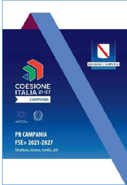
Opuscolo spillato e pieghevole