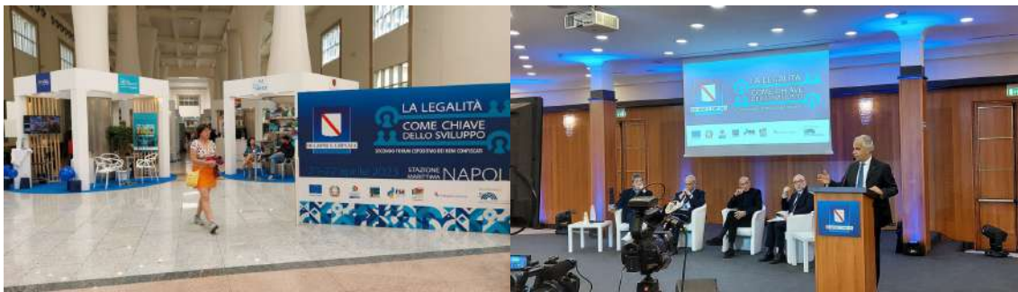
Forum Nazionale dei beni confiscati – II Edizione