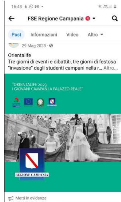
Sito istituzionale e social (Facebook)