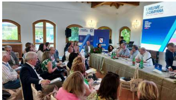
Il welfare per la Campania