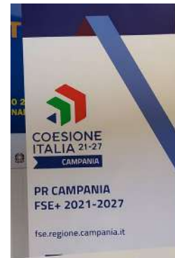
Materiali personalizzati (esempio carta intestata e rollup)