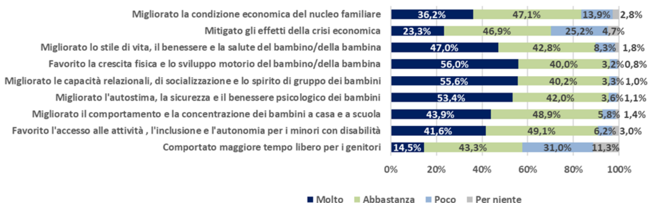
Grafico 1 - Effetti del voucher per l'accesso all'attività sportiva (v.%)

Gli obiettivi della misura risultano ampiamente raggiunti a maggior ragione se si considera il grado di addizionalità dell'intervento . Difatti, nel 32,1% dei casi i genitori intervistati hanno dichiarato che in assenza del voucher non avrebbero potuto iscrivere la bambina o il bambino all'attività sportiva: fra questi, il 97,2% apparteneva alle classi di reddito inferiori a 17 mila euro e il 67,6% al di sotto dei 10 mila euro. Questo dato evidenzia chiaramente il valore della misura nel garantire il diritto allo sport, nel facilitare l'accesso allo sport e nel prevenire l'abbandono della pratica sportiva da parte delle famiglie con difficoltà economiche . A conferma di ciò, nel 38,4% dei casi le famiglie hanno riportato che senza i voucher avrebbero iscritto i figli con difficoltà e nel 10,4% avrebbero dovuto cambiare la tipologia di disciplina sportiva, orientandosi verso attività più economiche. Infine, nel 19,1% delle risposte emerge come i genitori avrebbero iscritto ugualmente i bambini o le bambine alle attività sportive, elemento che conferma la capacità della misura di agire in termini di sostegno per le famiglie a basso reddito che cercano, nonostante la propria condizione economica, di garantire le attività sportive per i propri figli.